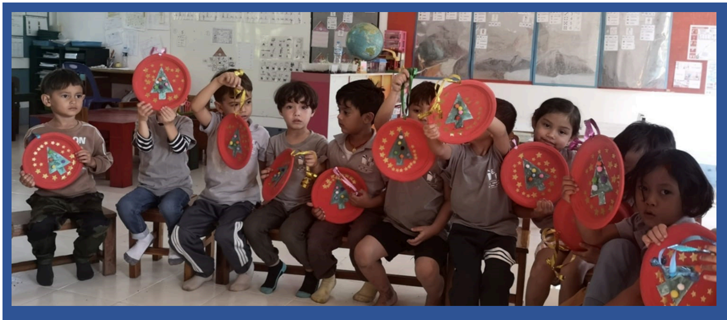
ສິ່ງທີ່ຊັ້ນອະນຸບານເຮັດໃນ 2 ຊ່ວງເວລານີ້ມີຫຍັງແດ່?

ພວກເຮົາປູກເມັດຖົ່ວແດງ. ພວກເຮົາຖູແຂ້ວທຸກໆມື້ຫຼັງຈາກອາຫານທ່ຽງ. ພວກເຮົາຫຼິ້ນເກມ