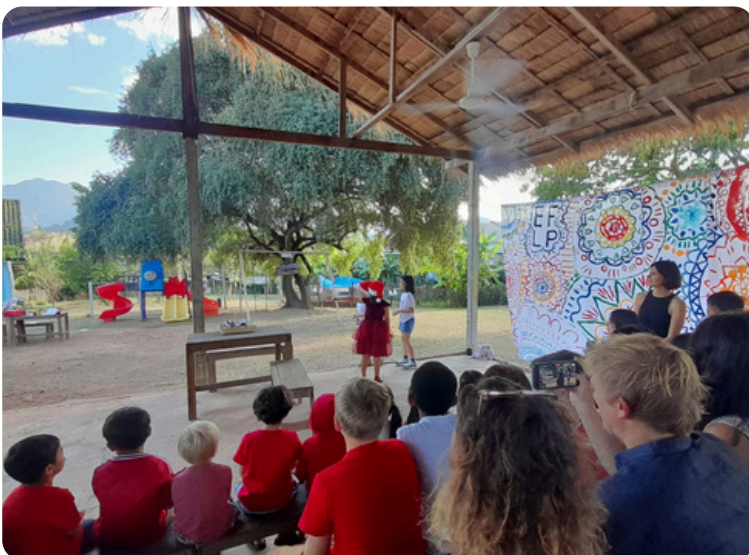
ງານສະແດງລະຄອນທ້າຍປີ!