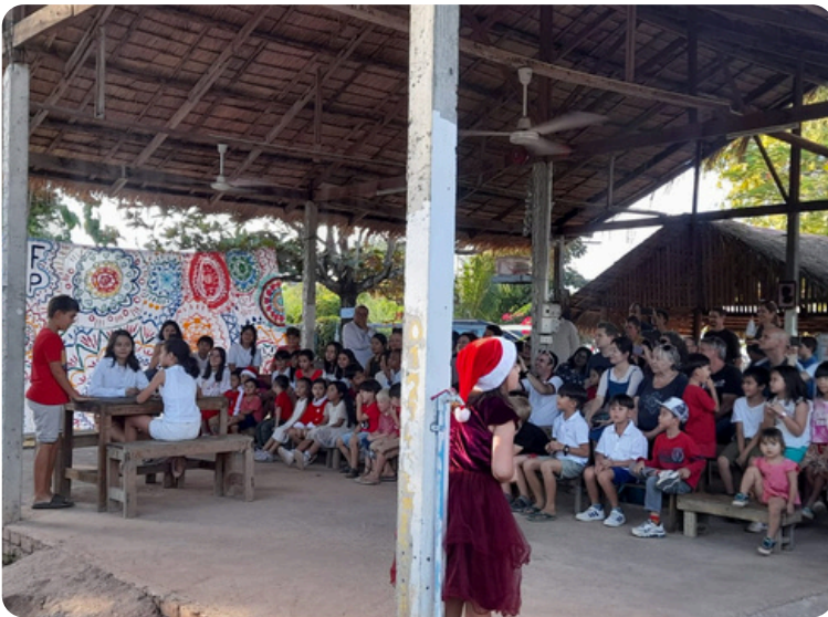
ການສະແດງລະຄອນຢູ່ໂຮງຮຽນ